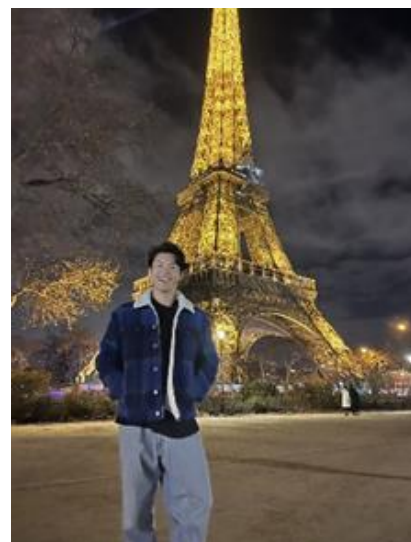
◎ 創発科学研究科 1年生 ◎ 2022年8月～12月まで アレス鉱山大学に留学

授業: マスターダメージ(防災・危機管理のコース) 授業では、同時期に入学した約50人の留学生たちと異文化交流を行いました。留学生の大半はモロッコやモーリタニアといったアフリカ出身の方が多く、アジアは中国やカンボジア出身の方が数名いた程度でした。授業は日によって前後するのですが、基本的に月曜日の午前9時から午後6時までであり、木曜日の午後はサークル活動を行う日になっていました。しかし、私は木曜日でも言語の学習に追われていたため、平日はみっちり勉強し、土日もしっかり遊んでいた感覚です。